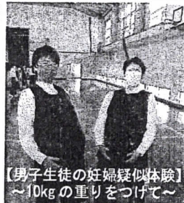
【男子生徒の妊婦疑似体験】 ～10kgの重りをつけて～