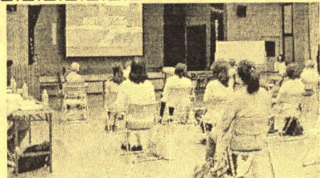
昨年度の講習会のような

※詳しい内容と申込書は、今回(6月1日)回覧の「青色パトロールカー(青パト)講習会のご案内」をご覧ください。