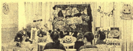
ハロウィン🎃パーティー