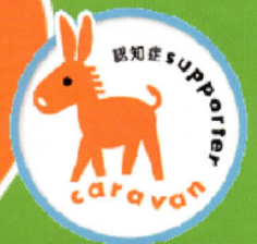
認知症サポーターキャラバン

糸島市の認知症サポーターが1万人 を突破しました キッズサポーターも活躍してます