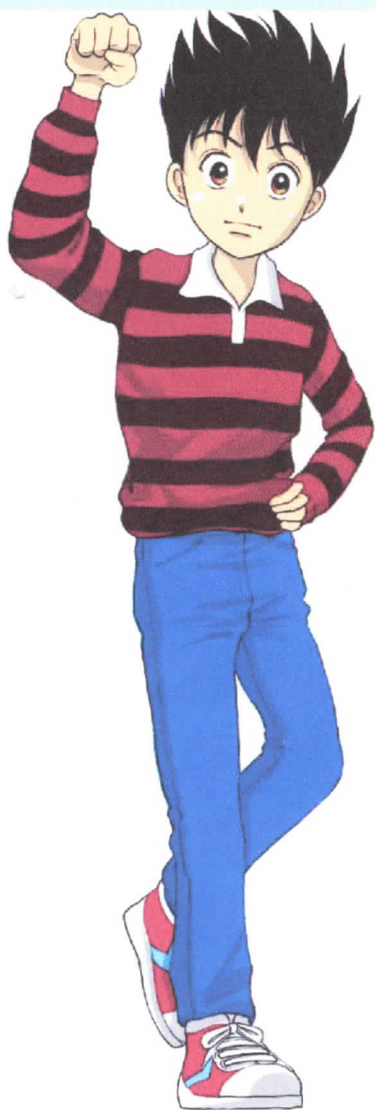
南風校区公式キャラクター 風太さん