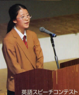
英語スピーチコンテスト