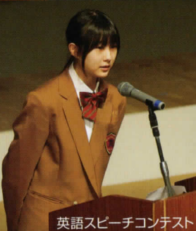
英語スピーチコンテスト