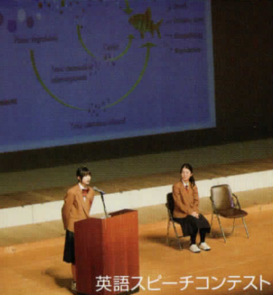
英語スピーチコンテスト