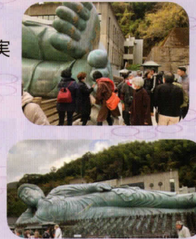
南蔵院の涅槃像（ねはんぞう）

今年のふれあいバス旅行は飯塚・篠栗方面への日帰り旅行を計画し、参加者52名と民生委員・児童委員、福祉委員9名の添乗スタッフの合計61名で実施しました。旅行先は筑豊の炭鉱王であった旧伊藤伝右衛門邸や南蔵院の涅槃像（ねはんぞう）を見学、途中カホテラスで昼食と買い物を楽しみながら、最後にやますえに寄って海産物加工品をお土産に帰途につきました。以前はおひとり暮らしの方限定でしたが、今年は参加対象の方を、65歳以上とした関係で予想よりも多数の応募があり、バスを2台で対応して希望者全員が参加出来ました。参加者からは「楽しかった！また行きたい！」との嬉しい声があり、スタッフ一同も大満足の日でした。また来年もご参加される事を心よりお待ちしております。