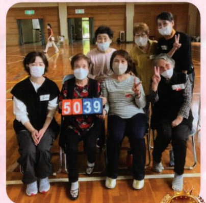
優勝された 『ほっとカフェAチーム』の みなさん