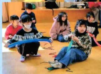
バルーンアートに挑戦！