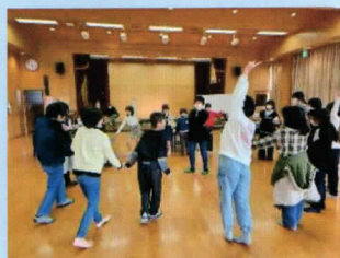
レクリエーション

●「イン・リーダー」は、子ども会内部のリーダーという意味です。子ども会の活動計画を決めて、会のみんなを引っ張っていく責任ある役割を担います。