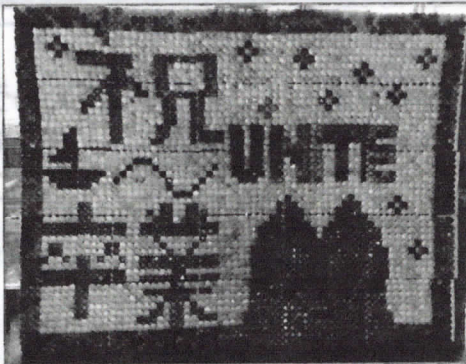
【ペットボトルキャップを使用した作品】

PTAからは、役員さんが生徒には内緒で、メールで保護者に依頼をして、卒業する生徒へのメッセージを桜の花びらに記入してもらい回収しました。また、前中校区の4つの小学校へも依頼をして、先生方からメッセージをいただきました。役員さんと保護者の有志で、桜の花びらを切り抜き、模造紙6枚分に散りばめました。一つ一つの花びらには、子どもを想う保護者の心情と新しい世界へ旅立つ子どもに対する激励のメッセージが綴られています。